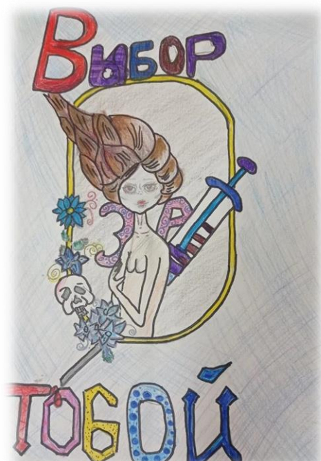
2 место ученица 6 кл. Крохалева Мария