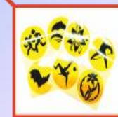
наклейки и значки