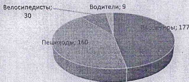
ДТП по категориям участников

Принимая во внимание результаты дифференцированного анализа детского дорожно-транспортного травматизма, при организации деятельности Госавтоинспекции Свердловской области необходимо обращать пристальное внимание на пресечение грубых правонарушений на дорогах регионального и местного значения водителями автотранспортных средств, связанных с выездом на полосу встречного движения, нарушения ими скоростного режима, не предоставления преимущества в движении пешеходам.